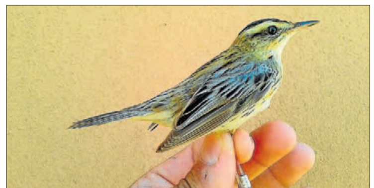
El taller constarà de dues jornades teòriques i pràctiques LEVANTE-EMV

gratori pel Parc Natural a través del projecte LIFE Paludicola. Un dels objectius d'esta trobada és donar a conèixer este projecte, els objectius a curt, mitjà i llarg termini i el seu pla d'acció. El taller constarà de dues jornades, el primer dia es desenvoluparà la seua part més tècnica, analitzant la situació actual de les aus palustres. En el seu segon dia es traslladarà al Prat on s'han programat diferents activitats perquè tots els interessats puguin conèixer més a prop les aus.