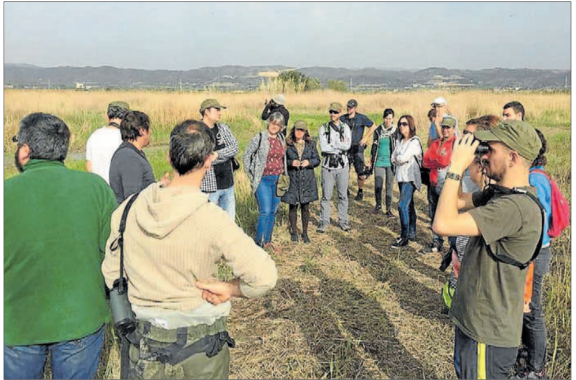
Els assistents van fer una excursió al parc natural del Prat de Cabanes-Torreblanca.

A més de la part teòrica, els assistents van poder visitar alguns dels paratges del parc natural de Cabanes-Torreblanca