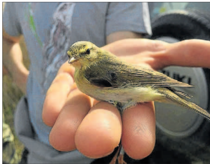
Un dels ocells estudiants pels experts este cap de setmana.