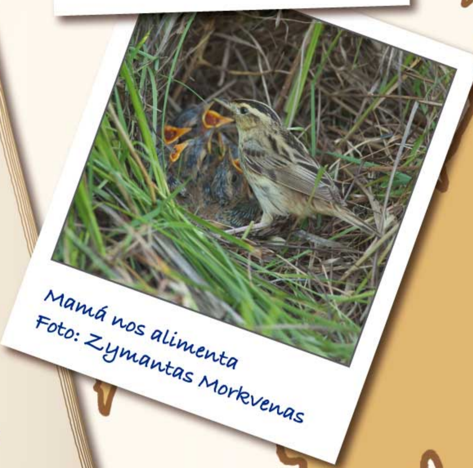
Mamá nos alimenta