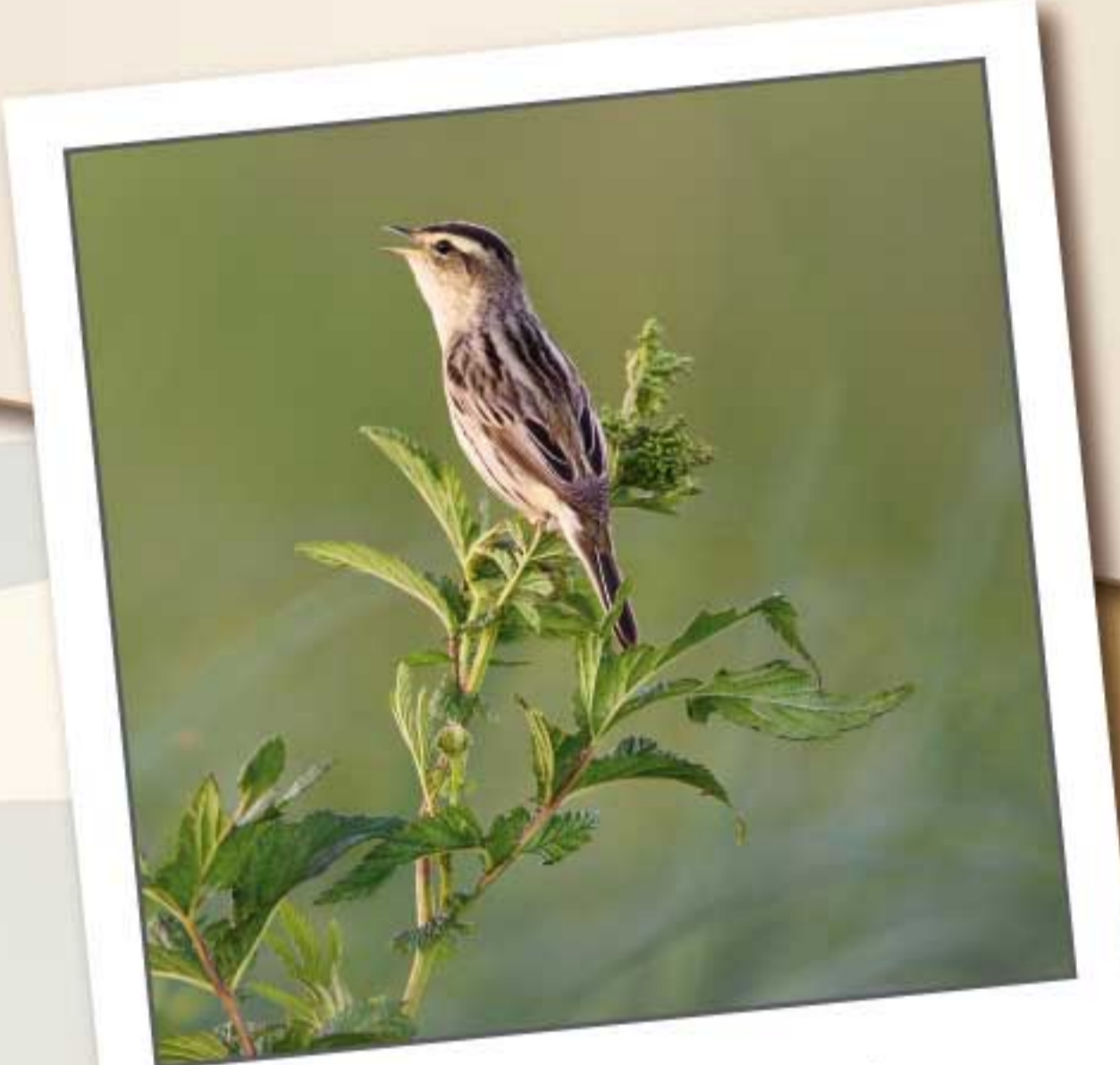
Cantando en el humedal

3 DE JULIO DE 2018 Han pasado 30 días. Mis hermanos y yo jugamos entre las cañas y los juncos. Ya hemos crecido bastante y falta poco para que alcancemos los 13 centímetros y los 11 gramos, que son el tamaño y el peso que tendremos a lo largo de nuestras vidas. Nuestra madre está incubando los huevos de la segunda puesta, no tardarán en nacer nuestros hermanos.