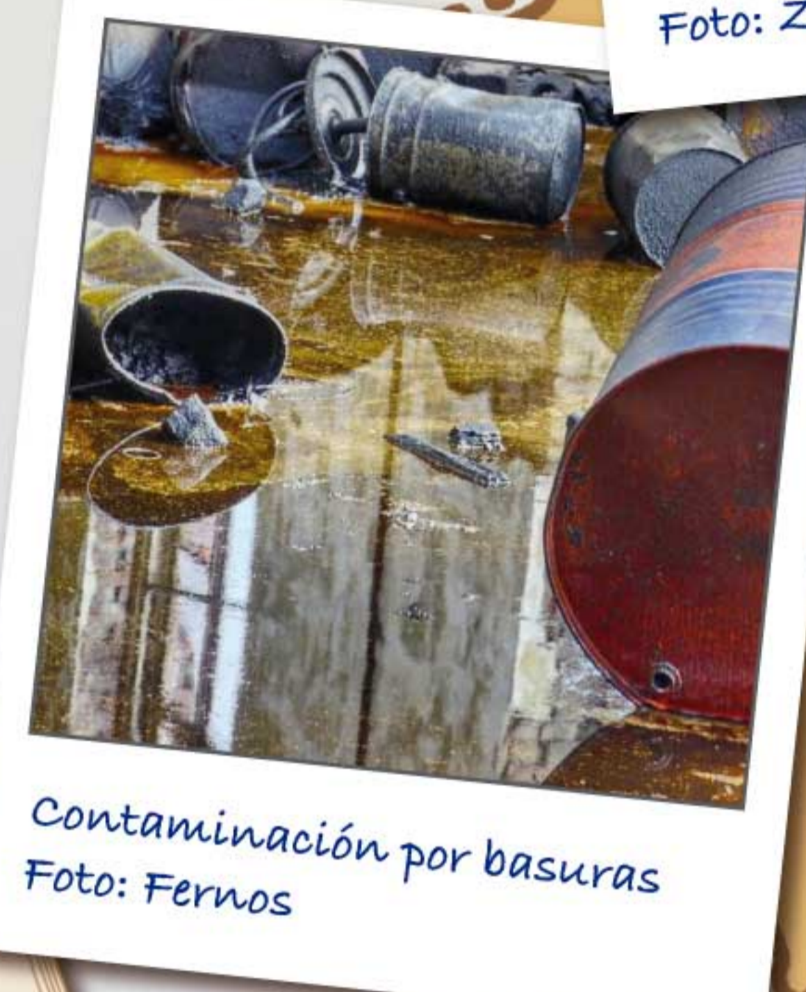
Contaminación por basuras

Antes era más fácil encontrar un lugar donde hacer el nido. Ahora, sin embargo, muchos humedales están desapareciendo porque están siendo desecados, drenados, canalizados, ocupados por ciudades o directamente contaminados por vertidos. Años atrás los ganaderos traían vacas a pastar, ellas compactaban el terreno y se comían la vegetación. Cuando nosotros llegábamos las plantas eran tiernas y jóvenes y eso nos permitía construir nuestros nidos. Ahora ya no vienen y unos enormes arbustos lo cubren todo.