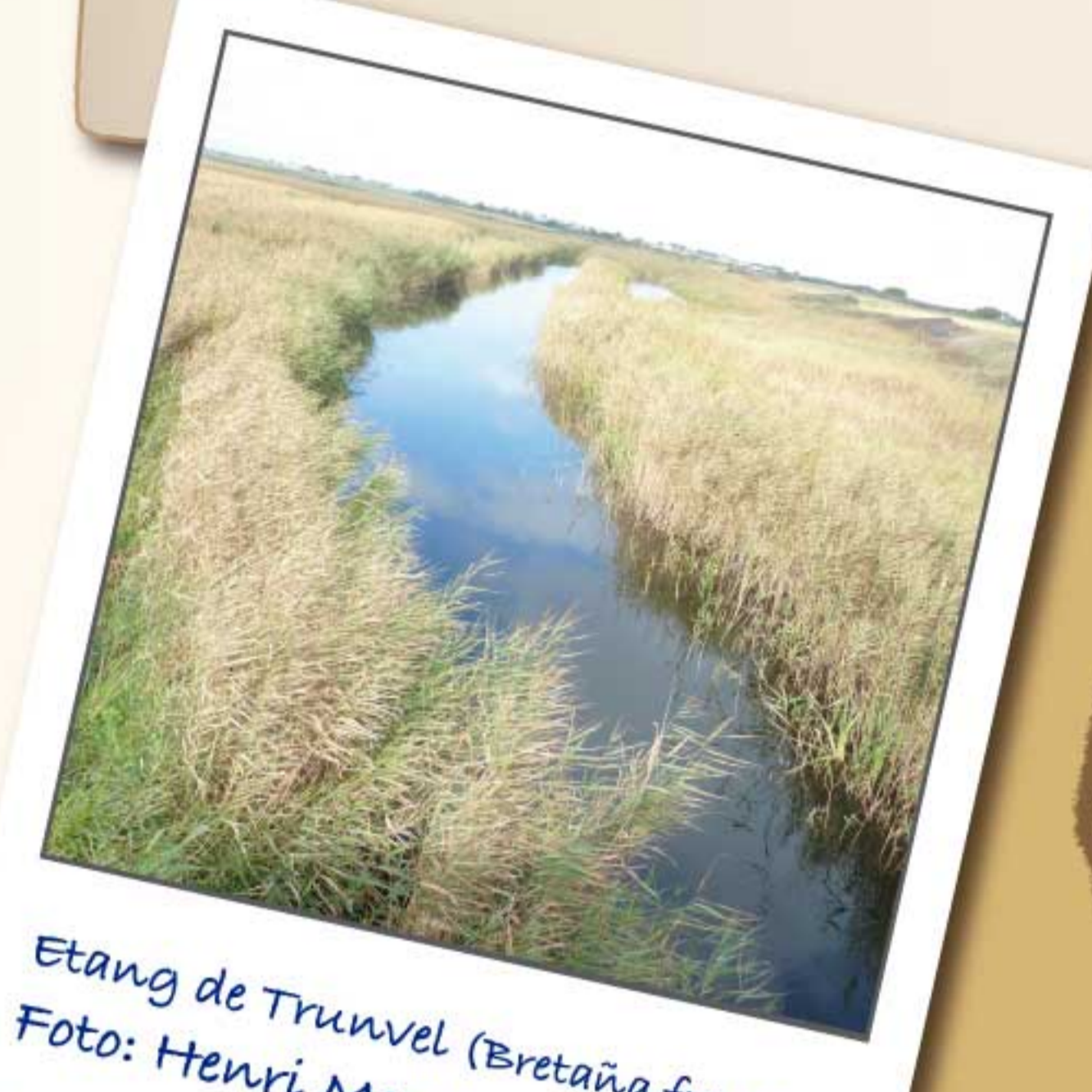
Etang de Trunvel (Bretaña francesa)

Hemos de planificar el viaje pues se trata de un duro recorrido y resulta difícil encontrar lugares para descansar y reponer fuerzas, por este motivo nuestra población se ha reducido un 95% en los últimos 100 años y nos han clasificado como especie "vulnerable" a nivel global y como especie "En Peligro" a escala europea.