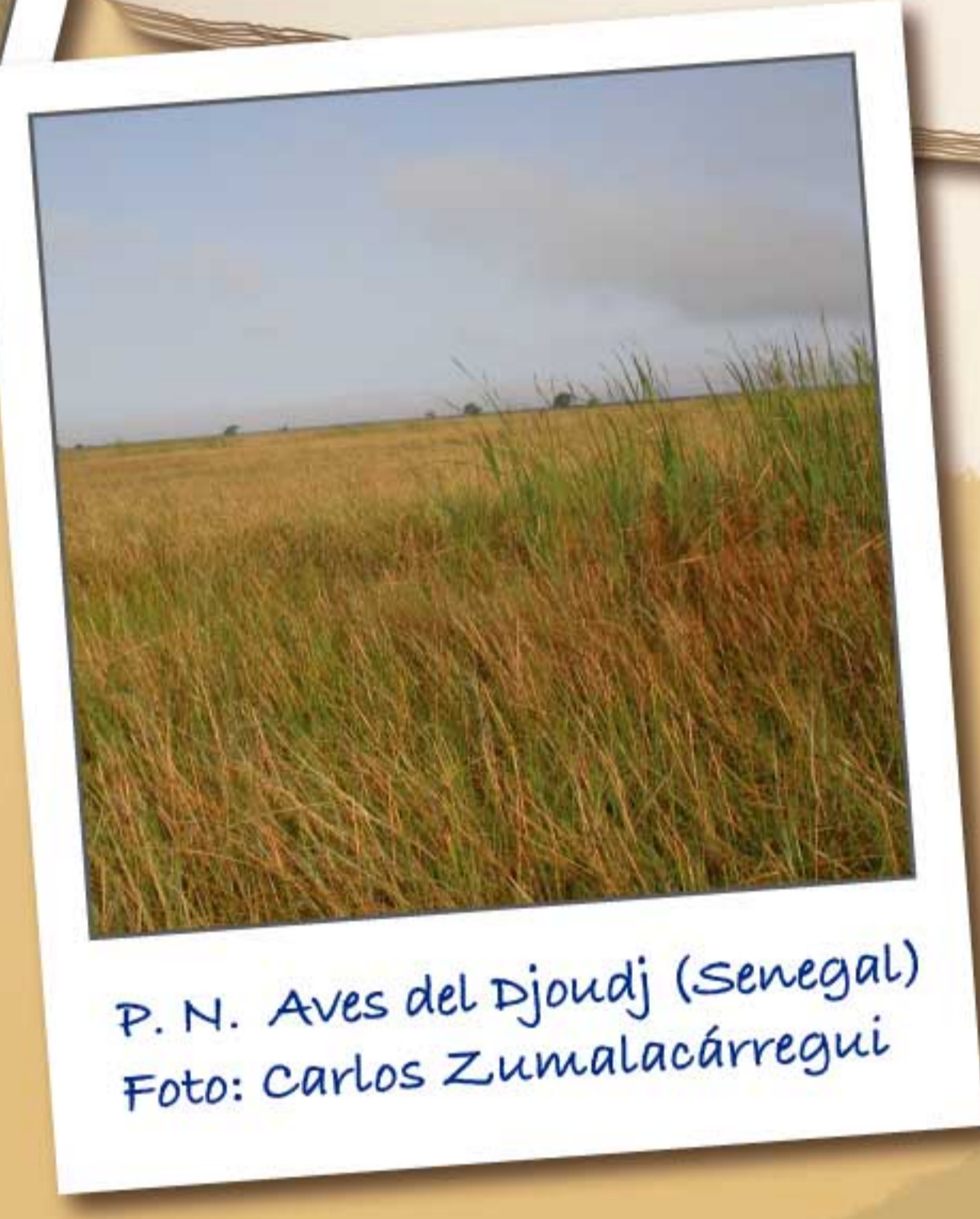
P. N. Aves del Djoudj (Senegal)

Nos contó que se había quedado atrapado en unas redes. Unos humanos, a los que llamó ornitólogos, le desengancharon y después de medirle, pesarle y ponerle una curiosa e inofensiva anilla en la pata, le soltaron. Aprendió que esas anillas tenían letras y números, como si de una clave secreta se tratase, y que servían para conocer mejor la vida de las aves y ayudarles a sobrevivir. ¡Es un presumido y se pasa el día mostrando su anilla a todo el mundo!