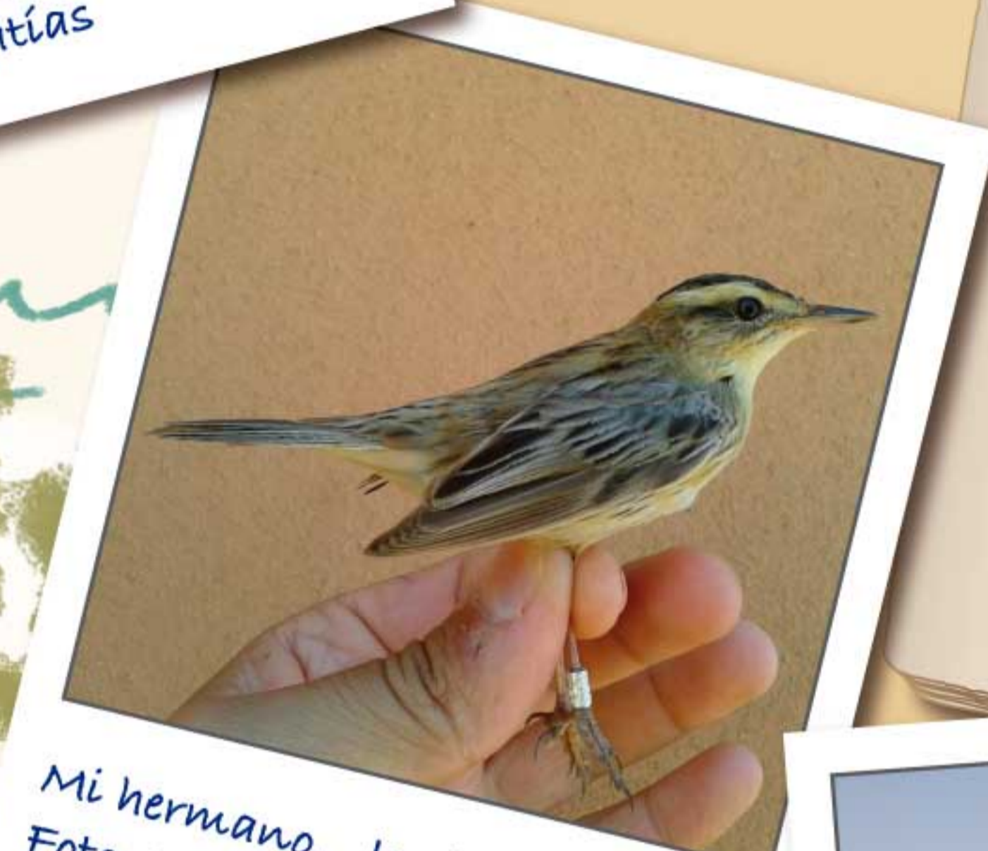
Mi hermano... luciendo anilla