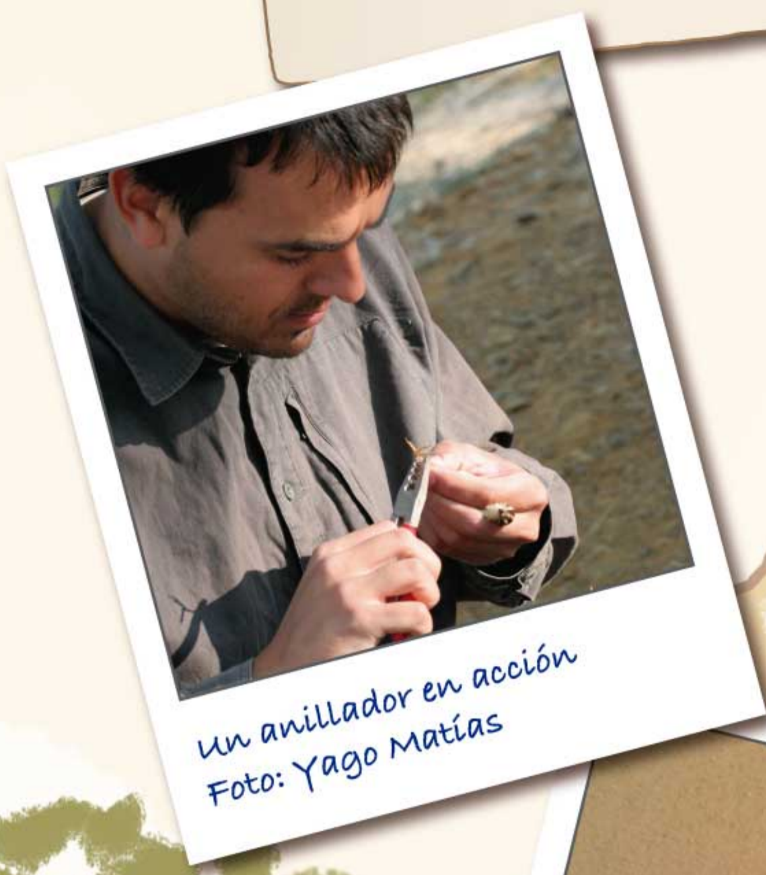
Un anillador en acción