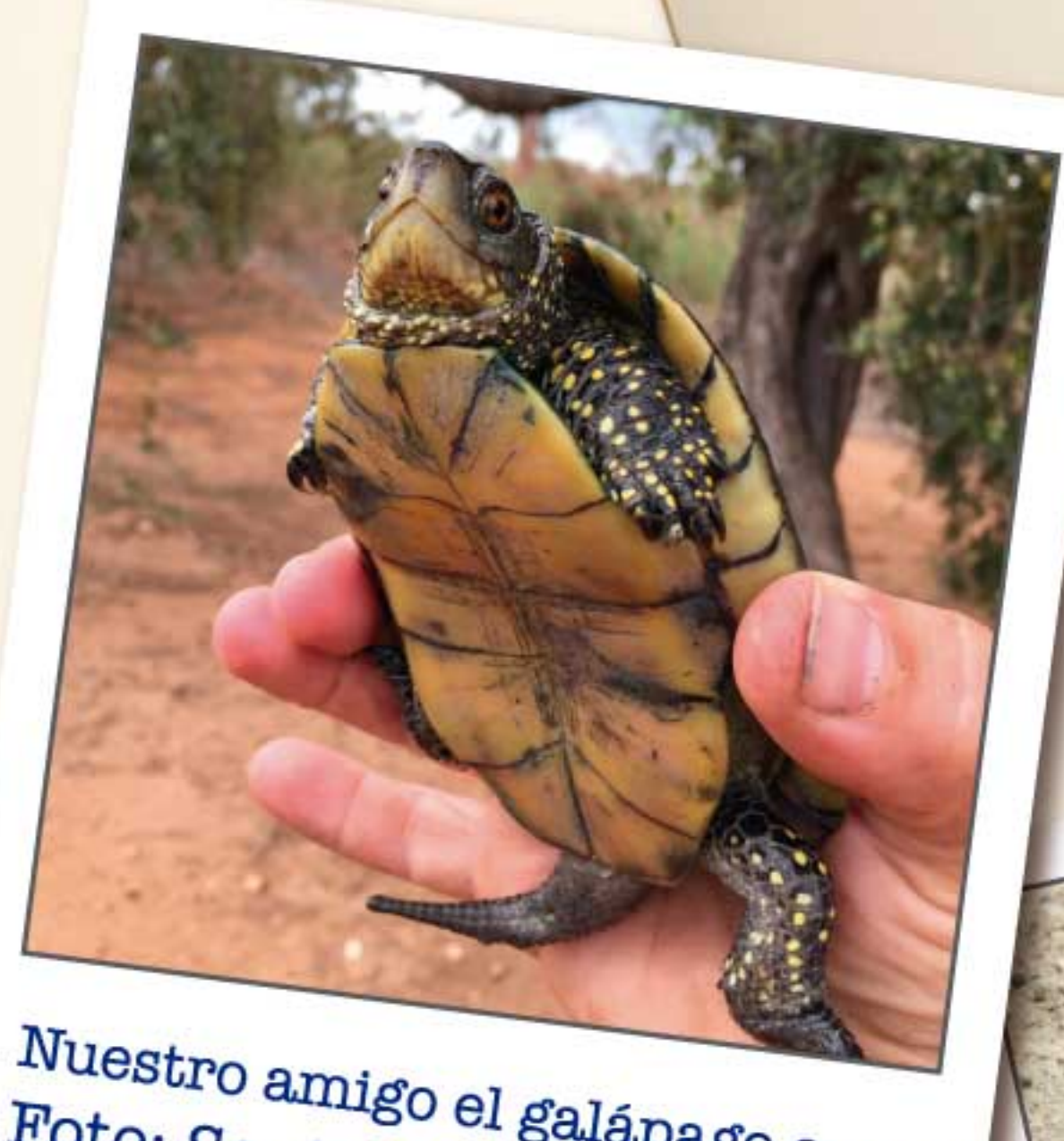
Nuestro amigo el galápagos europeo

Todos hemos sido bien recibidos por calamones, fochas, gallinetas, garzas, somormujos y zampullines que pasan aquí todo el año y que han estado encantados de enseñarnos su hogar. Ellos viven en estas preciosas lagunas que se encuentran pegadas al Mediterráneo y que combinan aguas dulces con olor y sabor a mar. Además, en las acequias de los antiguos arrozales, hemos podido conocer galápagos y pequeños pececillos valencianos a los que llaman samarucos y fartets. Mañana salimos y estoy segura que voy a echar mucho de menos este lugar.