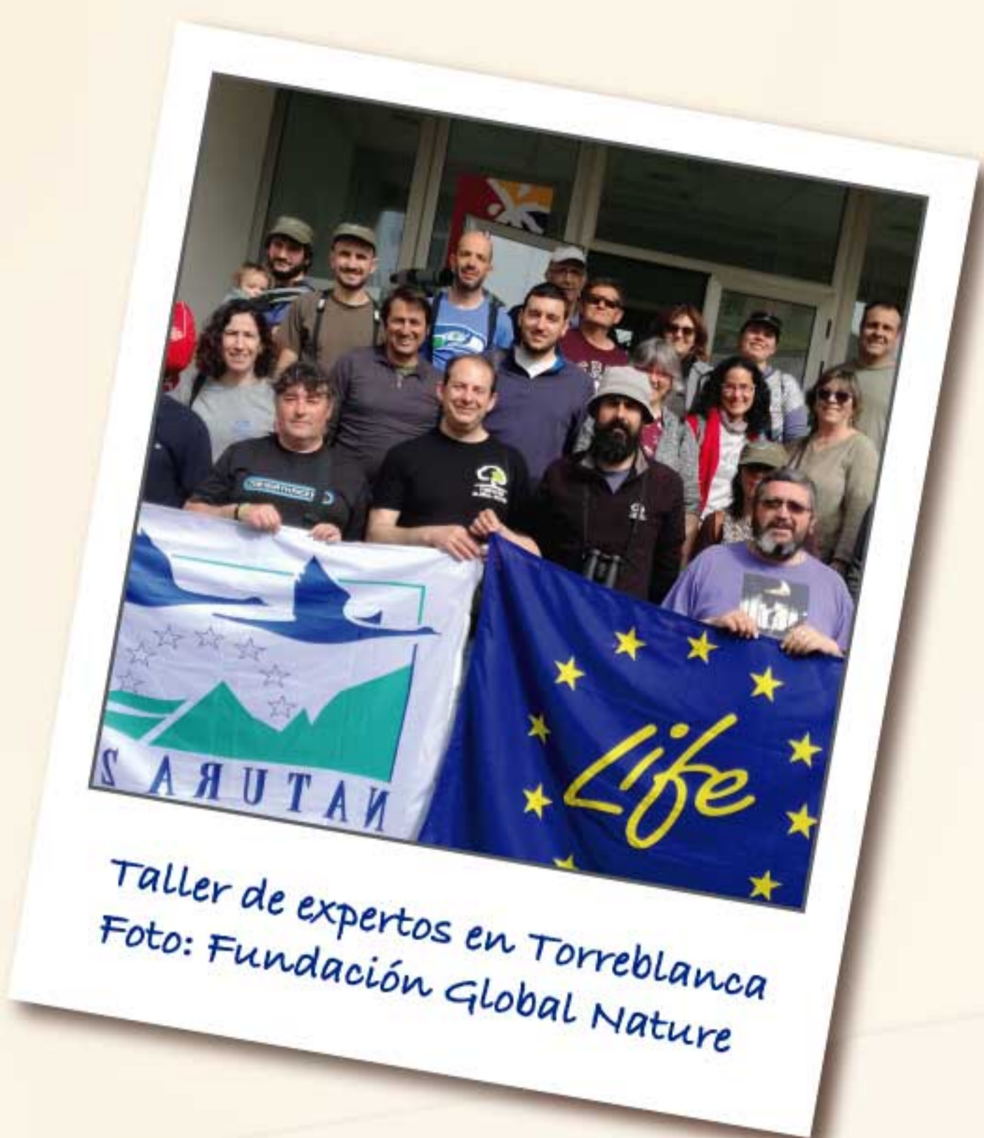
Taller de expertos en Torreblanca

Junto a esos grandes e impresionantes trabajos hemos visto pequeños gestos de personas que son igual de importantes y que no podemos dejar de agradecer.