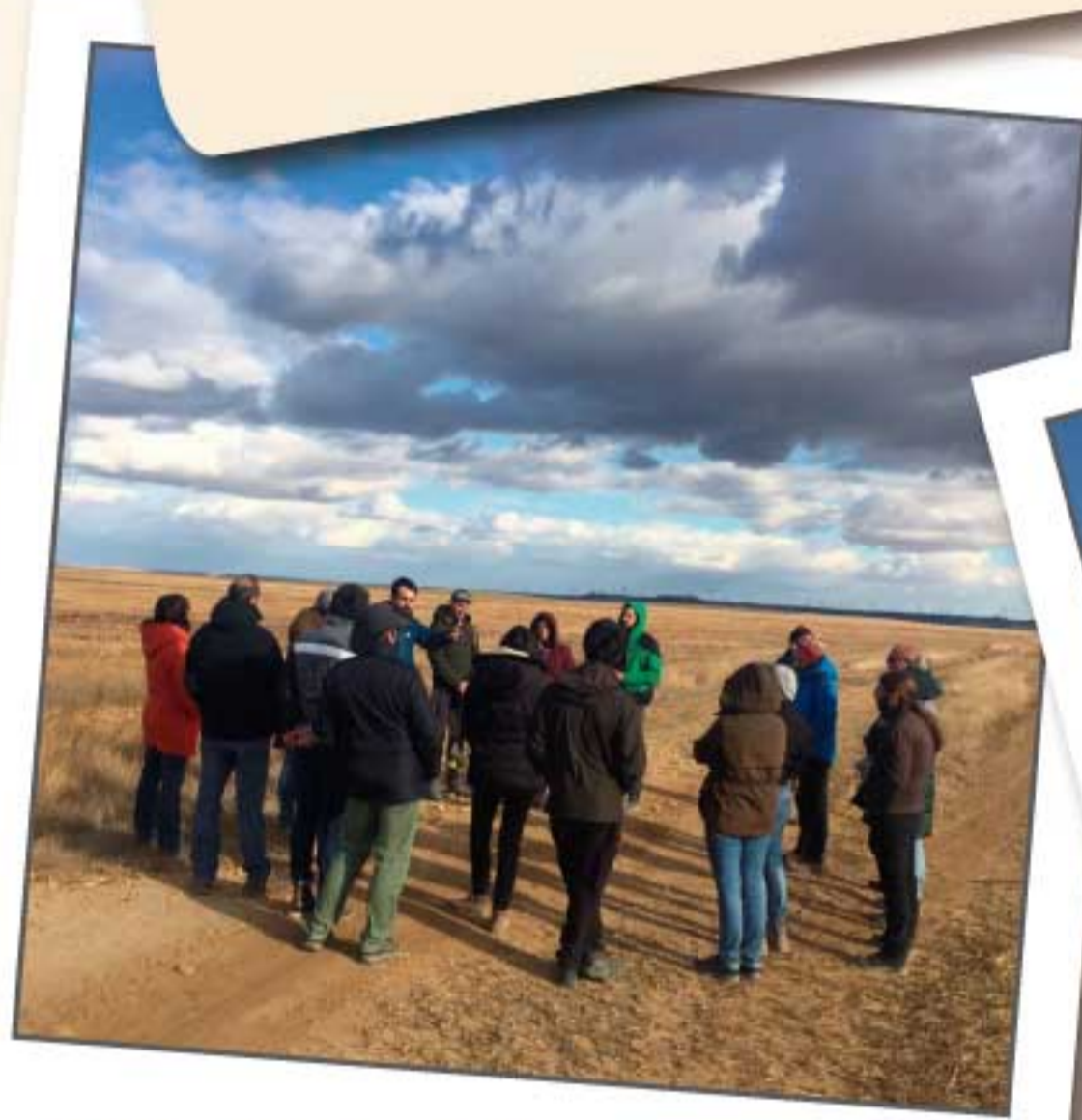
Compartiendo ideas