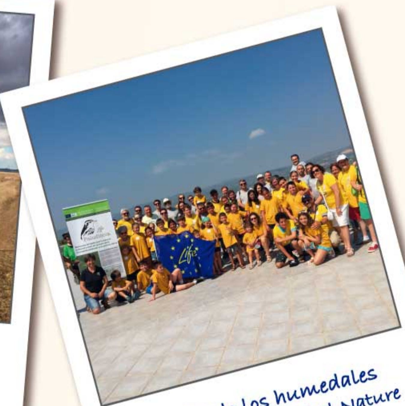
Conociendo los humedales

Hemos escuchado a agricultores interesados en la producción ecológica para evitar que se contaminen las lagunas.