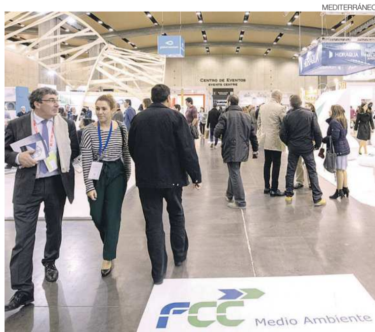
►► Empreses de Castelló com Facsa, estaran presents a la triple cita.

Al voltant d'unes 1.500 persones van visitar l'exposició en el seu periple per sis municipis i 13 parcs naturals, durant el període comprès entre juny de 2018 fins a finals de febrer de 2019. ≡