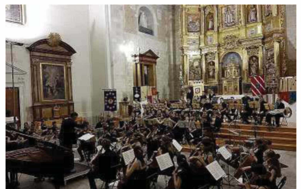
Imagen del último concierto celebrado en el monasterio de San Zoilo.

Hay que recordar que la Asociación de Amigos del Camino de Santiago ha organiza una nueva edición del Verano Cultural Jacobeo 2019 en la localidad de Carrión de los Condes. Las actividades se realizarán entre el 22 y 27 de este mes. El principal atractivo de este año es