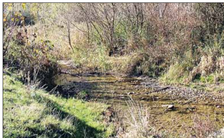
Un humedal en el sur de la provincia de León. DL

Por eso este año el Día Mundial de los Humedales, que se celebra cada 2 de febrero, está